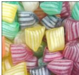
BÊTISE (de Cambrai)