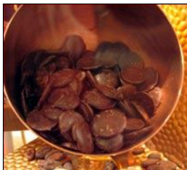
CROTTE (en chocolat)