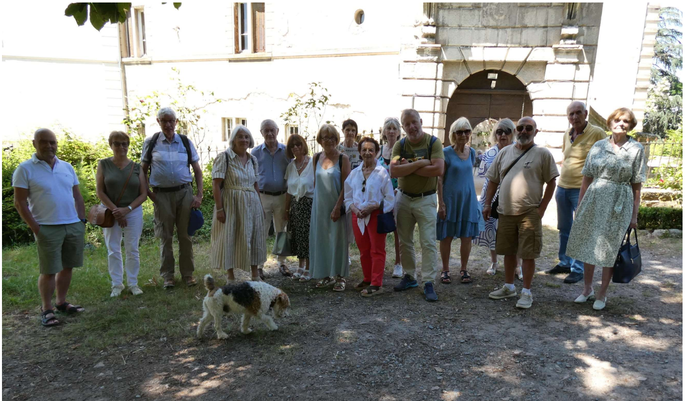
Un avant-goût de vacances dans un lieu chargé d'histoire.