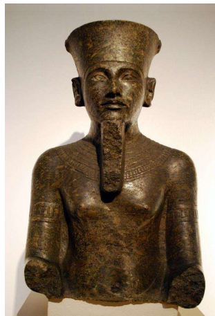
Statue de Toutankhamon en syénite

La SYENITE est une roche plutonique dont le nom vient de la ville de Syène (actuelle Assouan), en Egypte où se trouvaient de célèbres carrières.