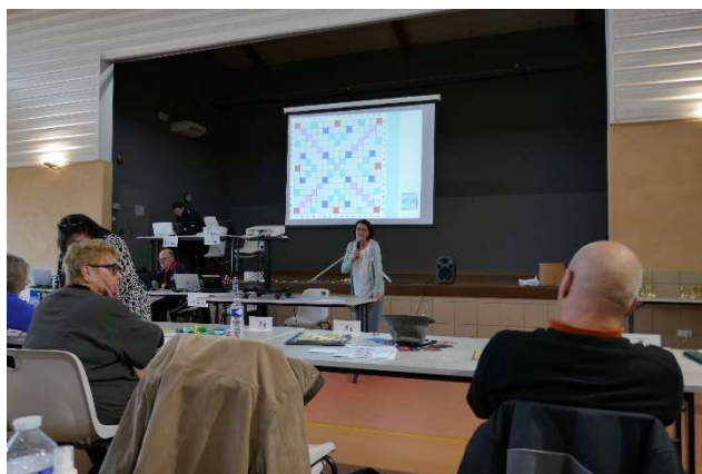
Le message de bienvenue