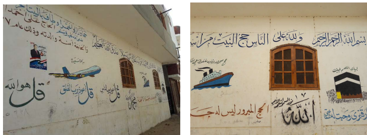
Mur de la maison d'un hadji avec les différents moyens de transport pour rejoindre La Mecque.

Coup 11 - JIHAD , élan missionnaire, guerre sainte menée pour propager l'Islam, anagramme de HADJI, titre honorifique pour désigner celui qui a fait le pèlerinage à La Mecque.