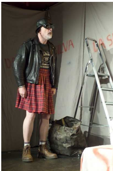
Bouboule en jupe

Comique visuel, comique des répliques, comique des situations... tous les leviers ont été exploités lors de cette comédie décapante.