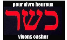
CACHERS CASHERE CASHERS

CALITOR : n.m. Cépage de raisins noirs d'origine provençale.